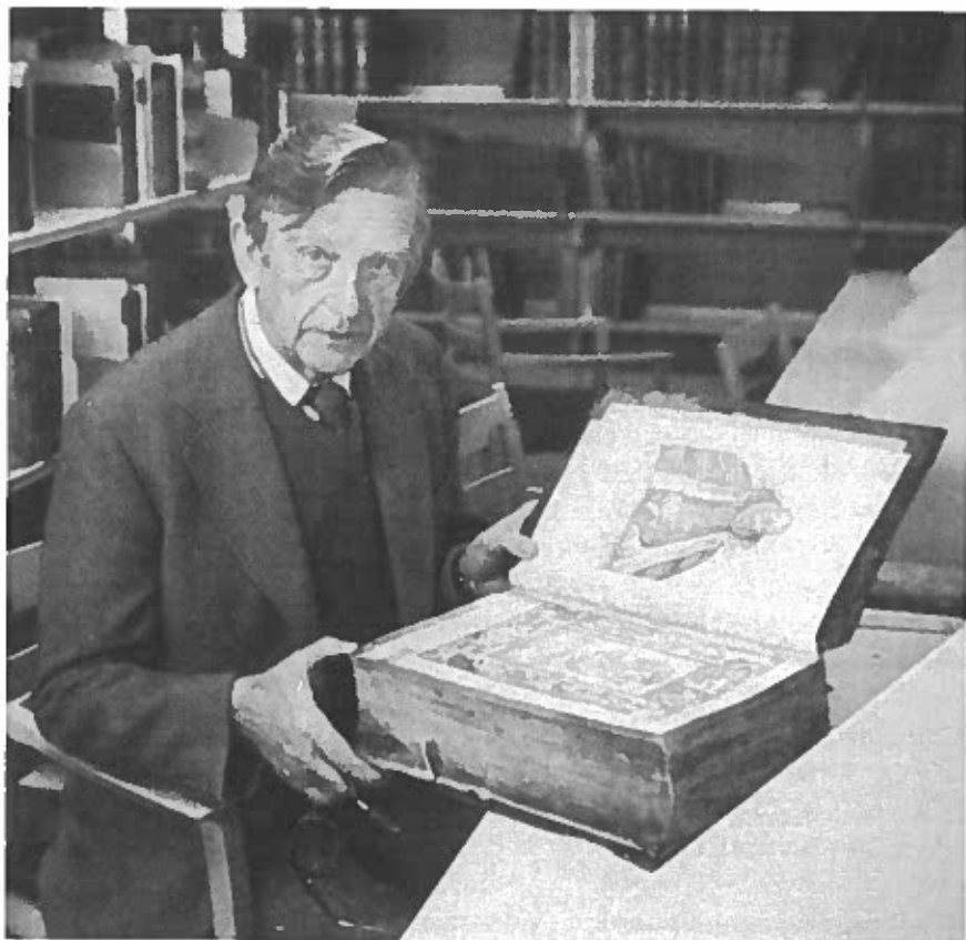
Engelsen med et eksemplar av Fredrik III's bibel, som er i Seminarets eie.

tanken om i Bibelen å skille det guddommelige fra det menneskelige. Det lar seg ikke gjøre å avgrense det rent guddommelige fra det menneskelige i den syntese som Guds åpenbaring er gått inn i for å kunne nå oss. Hvilket kriterium skulle vi forresten bruke for å finne det rent guddommelige? Vår kritiske fornuft og menneskelige vurdering? Personlig tror jeg ikke at den kritiske fornuft er den beste ledestjerne når en søker etter Guds hjerte. Den er nemlig avstemt etter denne verden, og er gitt for orientering i denne verden.