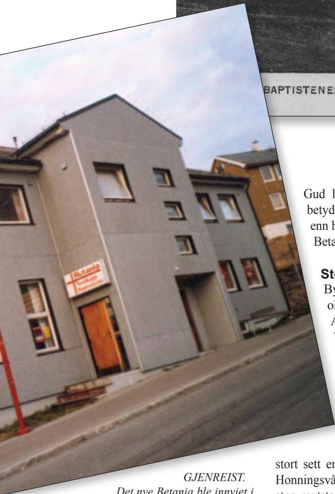
GJENREIST. Det nye Betania ble innviet i 1956.

kjærlig, velgjørenhet». Det er tankevekkende at det i våre historiske skrifter karakteriseres som det første i sitt slag.