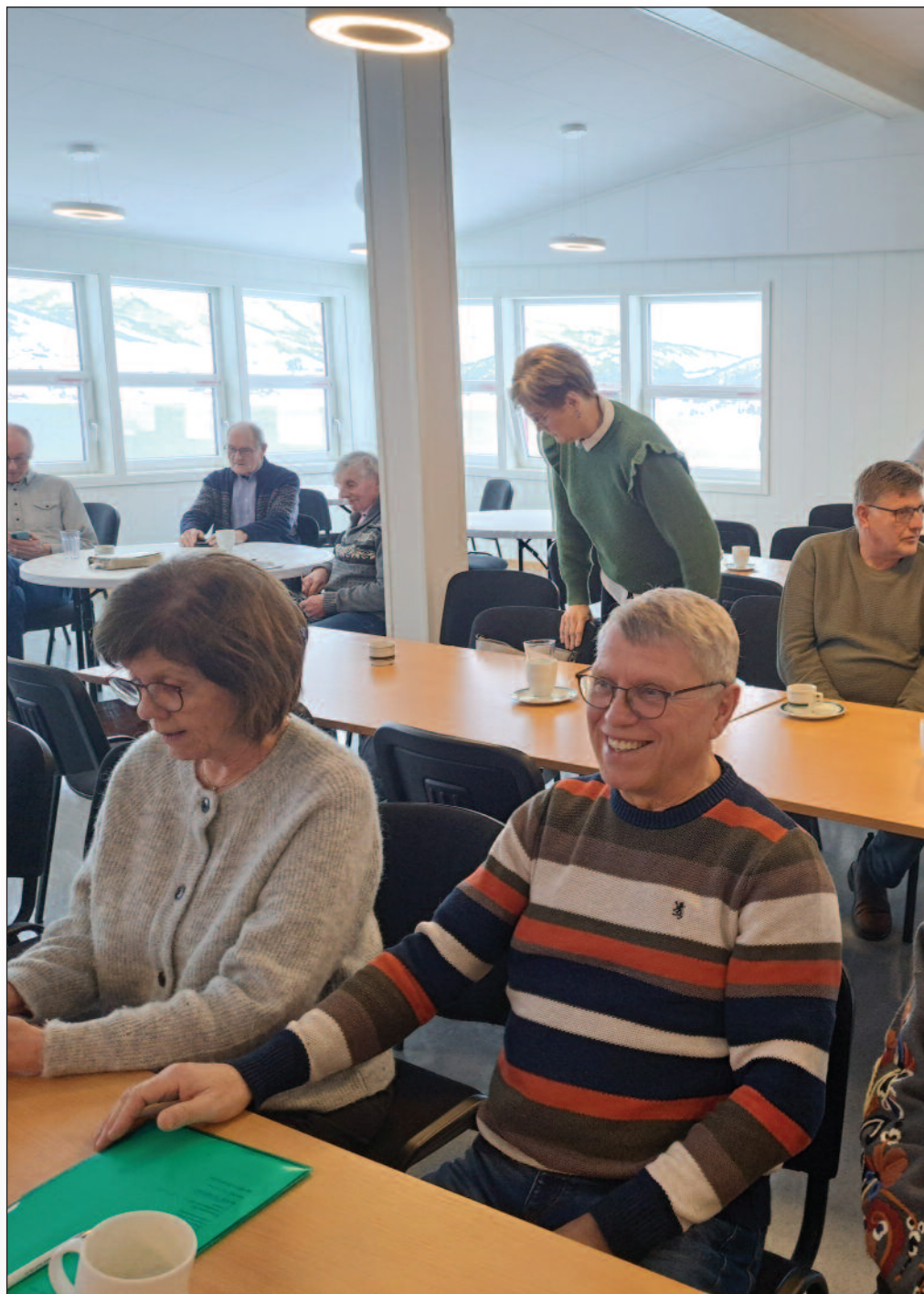
PÅ ÅRSMØTE En del av årsmøteforsamlingen i Baptist Nord i februar. Årsmøteforsamlingen hadde st