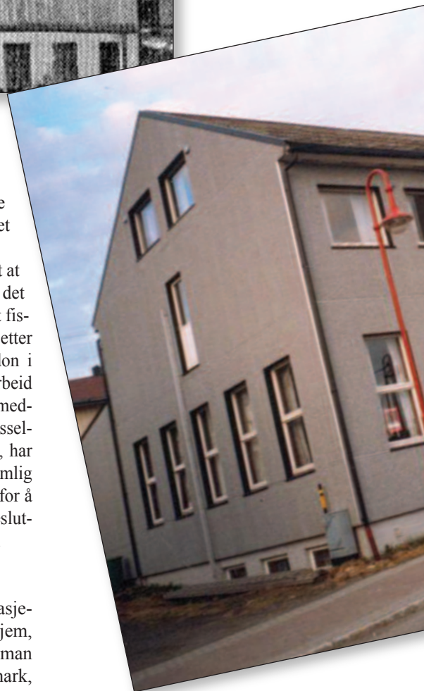
Honningsvåg i 1920.

Jeg aner at det bak dette sterke engasjementet for nettopp å bygge et fiskerhjem, ligger sterk strategisk tenkning. Når man skulle satse i et stort fiskevær i Finnmark, var et fiskerhjem på den tiden utvilsomt et strategisk riktig valg. Som eksempel nokså enestående i Norsk Baptisthistorie. Så kan vi jo stille oss spørsmål ved om vi opp gjennom generasjonene siden har studert lærdommen som ligger i prosessen som foregikk rundt byggingen i