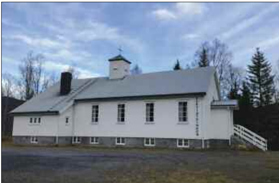
Det er i år det 75 år siden Baptistkirka i Vassli ble innviet. Dette ble markert søndag 11. september.