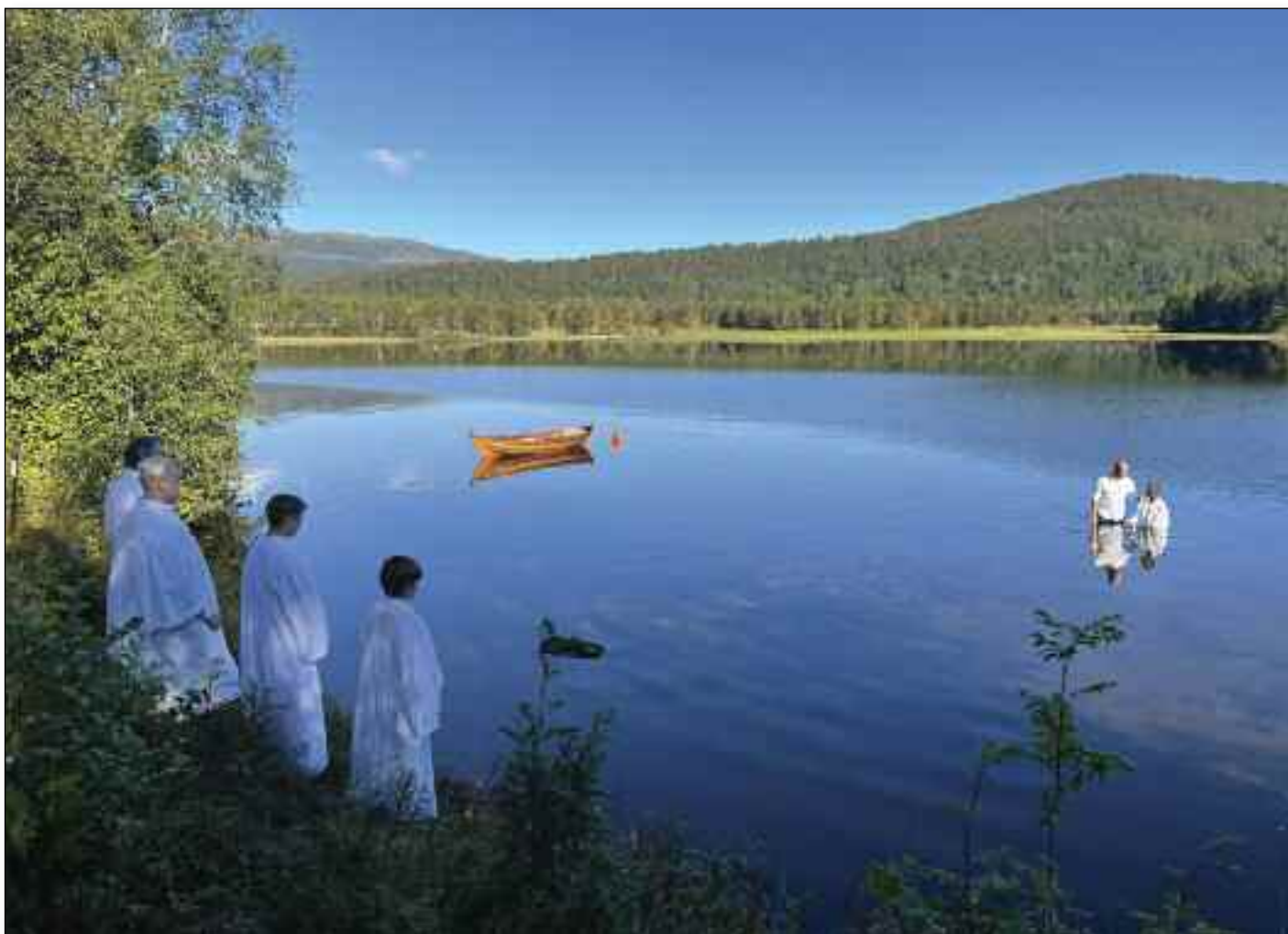
Ikjen har det i høst vært dåp i Djupvatnet like bak Vassli Kirke. Fire ungdommer ble døpt.