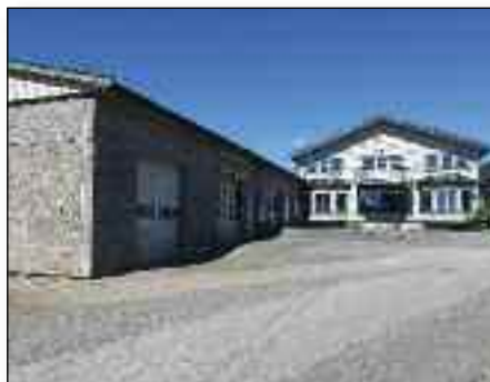
I den store lagerhallen vil menigheten få gode kirkelokaler.

Jeg var så heldig at jeg fikk møte en gruppe fra menigheten rett etter overtakelsen 31. august. Da fikk vi be om Guds velsignelse over menigheten, bygget og prosessen som kommer nå. ■