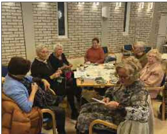
Bildene viser glimt fra et foreningsmøte i 2022, etter 140 år, samt kvinneforeningen etter 40 år, i 1922, etter 100 år i 1982.