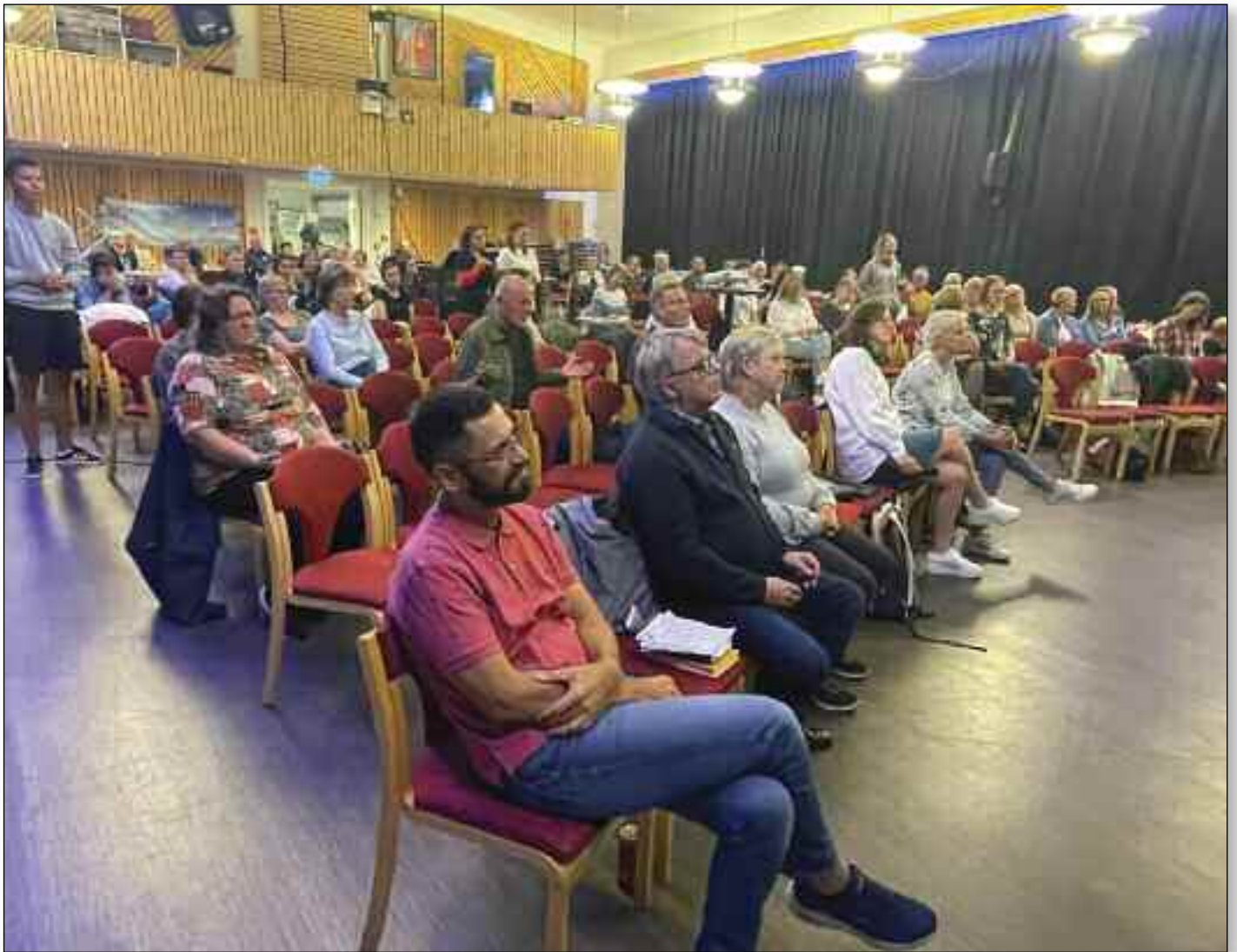
Flott forsamling samlet i Honningsvåg.