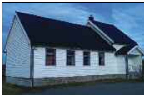
Bedehuset Fristad på Nordmela.

latt vederlagsfritt til den lokale velforening-en. Velforeningen fører arven videre og har valgt å opprettholde kirkebygget som stedets bedehus. Det brukes til gudstjenester i regi av Den norske kirke og andre, til begravelser og eller til kirkelig virksomhet når anledningen gir seg. ■