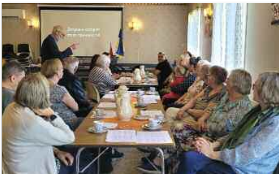
Fra sommerens lørdagstreff i Baptistkirka på Storsteinnes. De nye ukrainske vennene sitter øverst ved bordet.