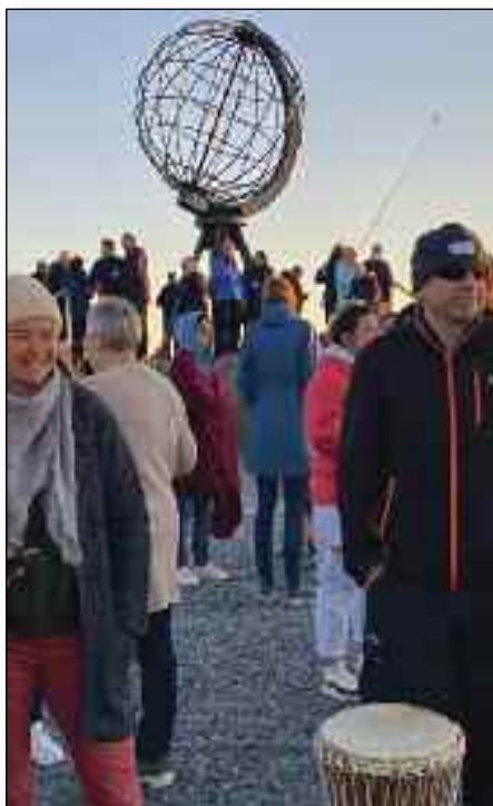
Også friluftsmøte på plataet på Nordkapp hørte med i konferanseprogrammet.

Vi fikk gjennom konferansedagene del i sterk og god undervisning og forkynnelse. Et stort lovsangsteam/ lovsangsband tok oss med i sterk og god sang, en ungdomsflokk på rundt 20 preget konferansen, og der var et godt opplegg for barn. Det var også til stor oppmuntring og velsignelse å møte mange nye venner. Forsamlingen var på det meste rundt 150. ■