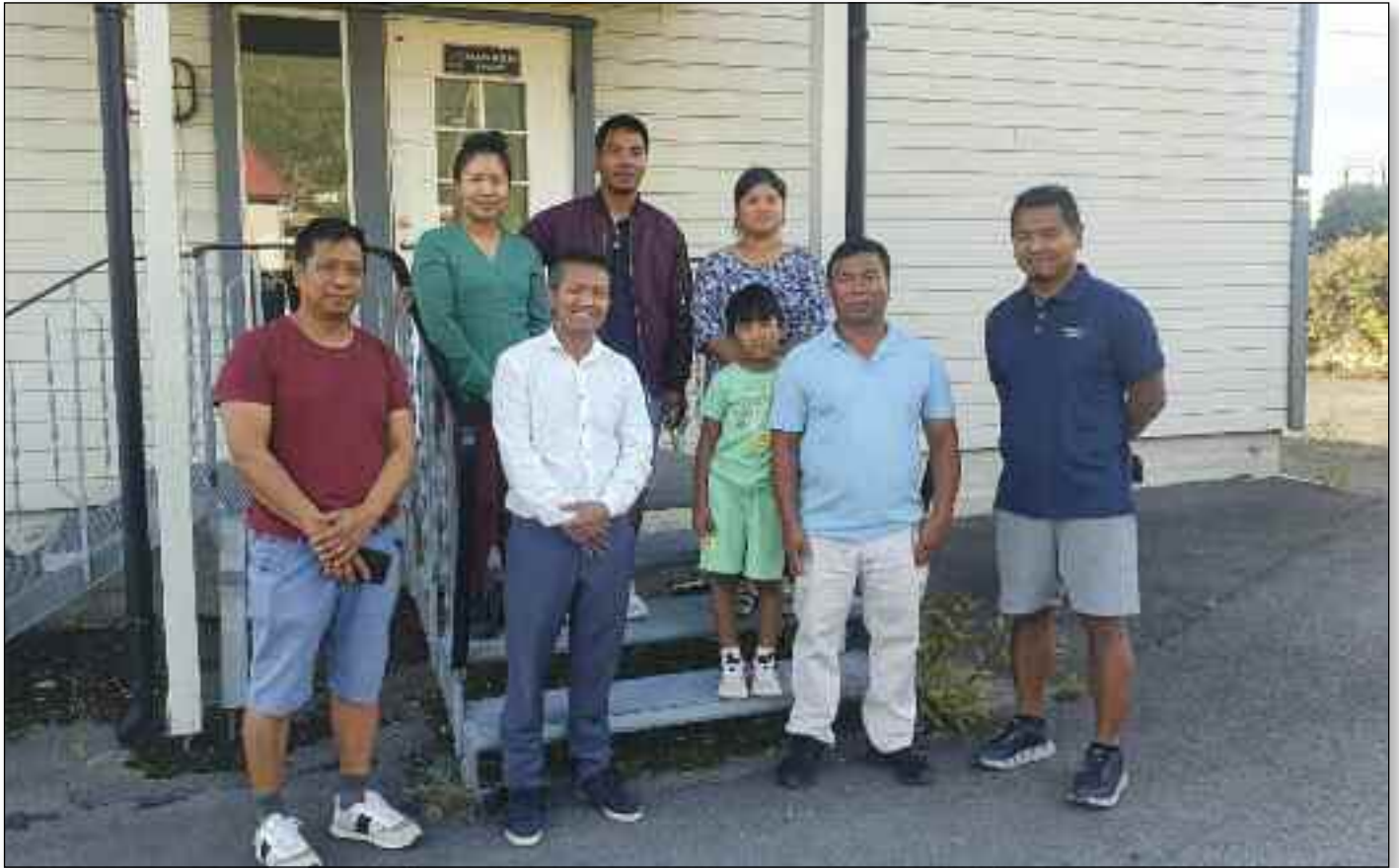
En gruppe fra menigheten samlet ved inngangen til eiendommen som skal bli baptistkirke.