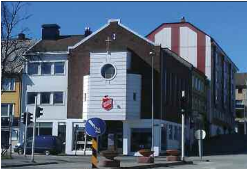
Den tidligere baptistkirken i Narvik har blitt korpslokale for Frelsesarmeen.

I serien om baptistkirker som ikke brukes til det lenger har vi denne gangen gleden av å presentere to gamle baptistkirker som fremdeles brukes som kirke-lokaler, bare med nye eiere.