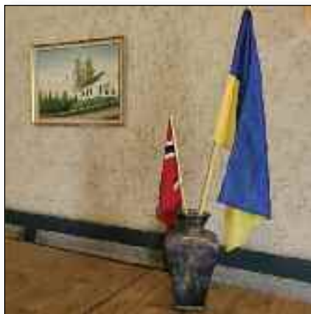
I Baptistkirka på Storsteinnes fantes faktisk et Ukrainsk flagg. Kanskje noe profetisk over at det Norske og Ukrainske flagget står sammen foran bildet av den gamle Baptistkirka på Storsteinnes.

(på gjensyn)! Men en slik henvendelse avviser man selvfølgelig ikke på grunn av noen språkutfordringer. En representant fra Flyktingetjenesten og jeg dro sammen på besøk til dette paret på deres midlertidige bosted, ca 1 mil fra Storsteinnes. Hun hadde truffet dem tidligere, og jeg presenterte meg ved å si navnet mitt og ordet baptist. Vi fikk en varm og hjertelig mottakelse, og en