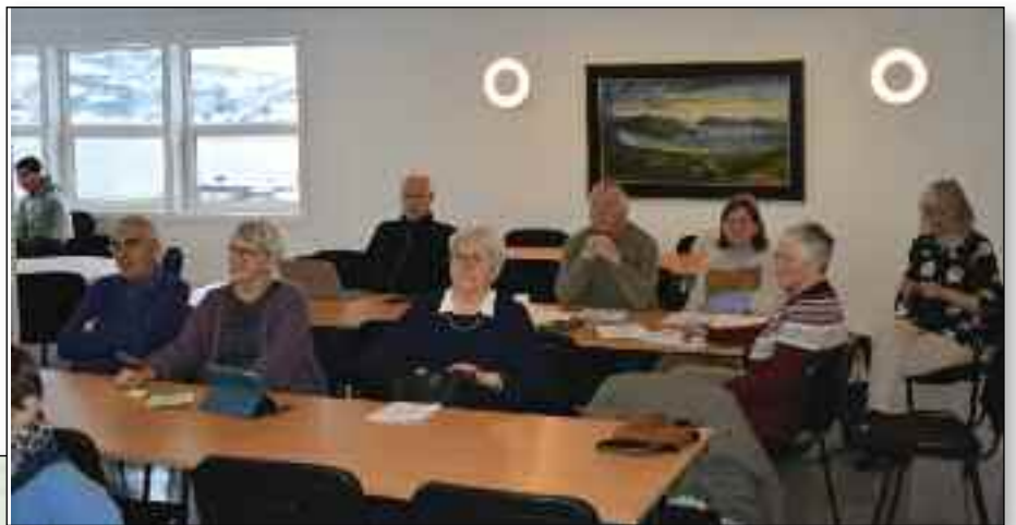
Ballangen/Narvik, Andenes, Åse og Sommarøy var godt representert i årsmøtet