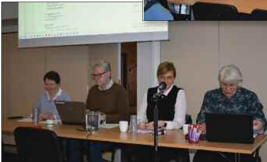
Ordstyrerne og sekretærene hadde full kontroll, og gjorde en god innsats

Delegater fra Harstad, Sommarøy og Kasfjord kunne konstatere at årsmøtet hadde gode samtaler, og vilje til gode løsninger.