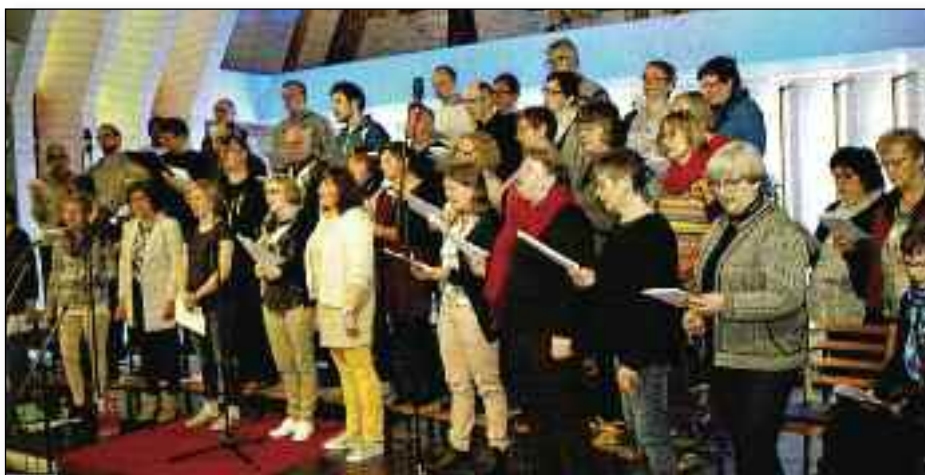
I mars holder koret sin siste konsert i Harstad.