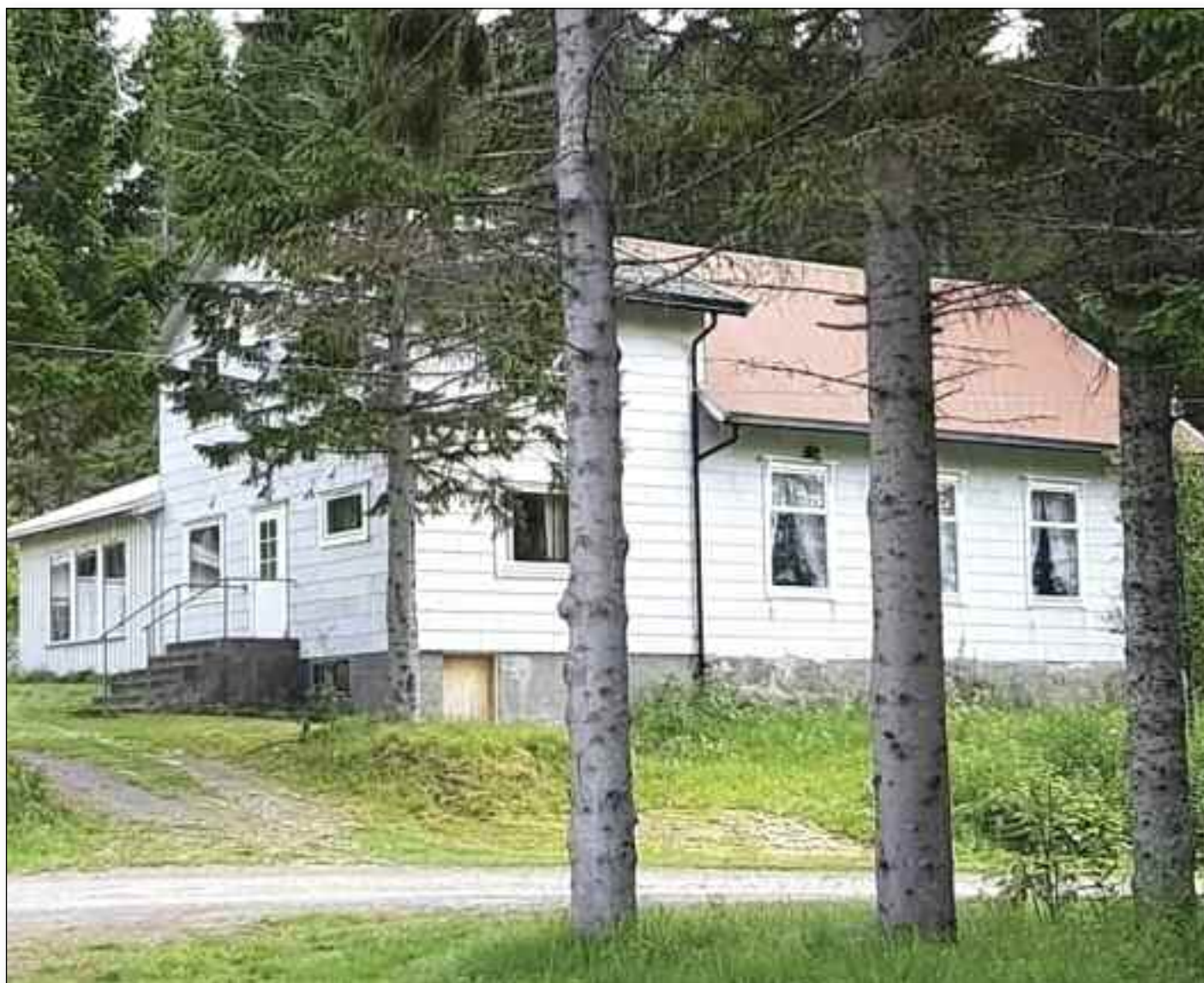
Baptistenes lokale i Hadsel.