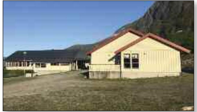
Rivermont blir nå tilrettelagt også for personer som er avhengig av rullestol.

Et Rivermont med respekt for seg selv må ha en handicaptaolett. Dette har vært