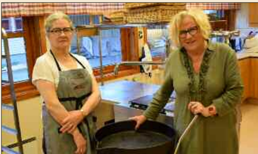
Kjøkkentjeneste er en viktig del av samlingene på Rivermont.

I dag kan vi smile litt over hvordan det var. Men de som påtok seg oppgaver