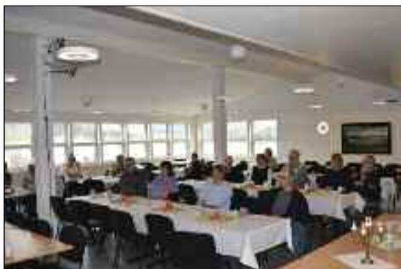
Utbyggingen på Rivermont har kostet, men resultatet har blitt særdeles bra. Blant annet en flott møte- og spisesal.

Utover dette var det 37 personer – som ikke er med i Rivermonts Venner, som ga til sammen 37200 kroner.