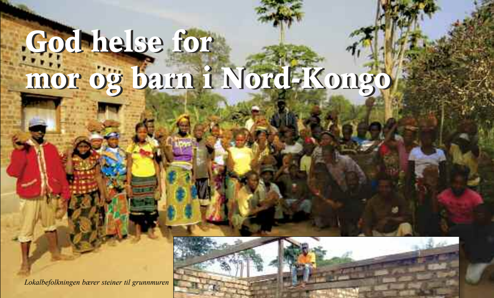
Lokalbefolkningen bærer steiner til grunnmuren