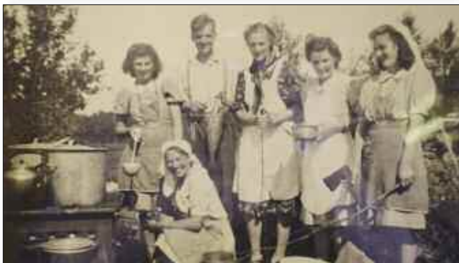
Det har vært en eventyrlig utvikling hva kjøkken angår. Fargebildet er fra dagens Rivermont, mens sort/hvitt bildet er fra en juniorleir, sannsynligvis på Bjarkøy.