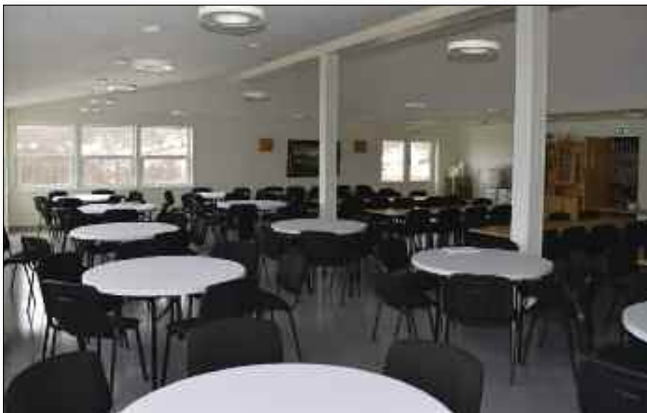
Møte-/spisesalen er blitt lys og trivelig, og bidrar sterkt til at bruk av møtetelt er historie.

Tidligere er begge påskeleirene og juni-orleiren avlyst pga coronaviruset. ■