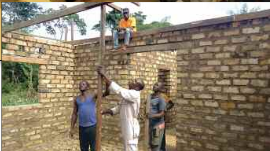
Over: Fødestuen i Dengu er under bygging. Under: Fødestuen i Dengu er ferdig.

Siden 1920 har baptistene i Norge støttet arbeidet til baptistene i Nord-Kongo - Communauté Baptiste du Congo Nord (CBCN), som har sin virksomhet i provinsen som heter Bas-Uélé.