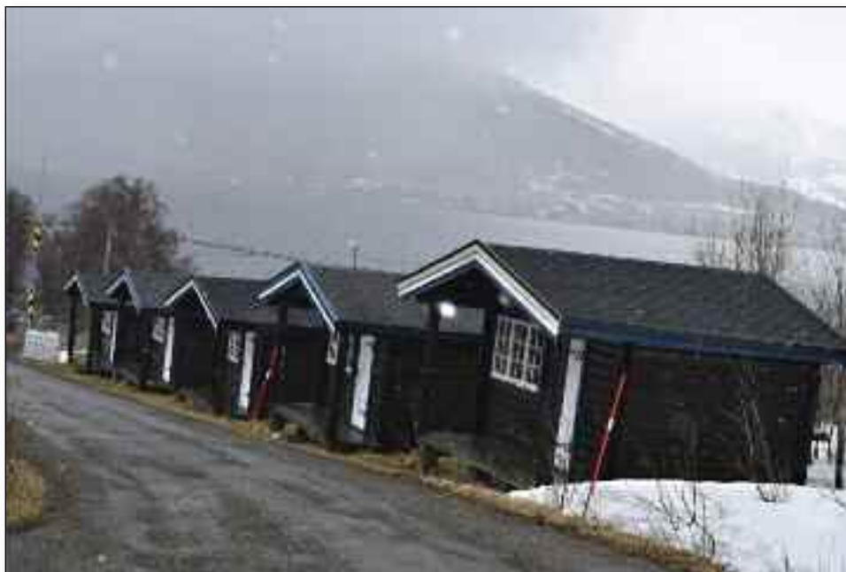
Hytte nr 2 og 4 trenger nye tak.

Sommerdugnaden starter på St.Hansaften, og det åpner jo for noe smakfullt på ettermiddag/kvelds. ■