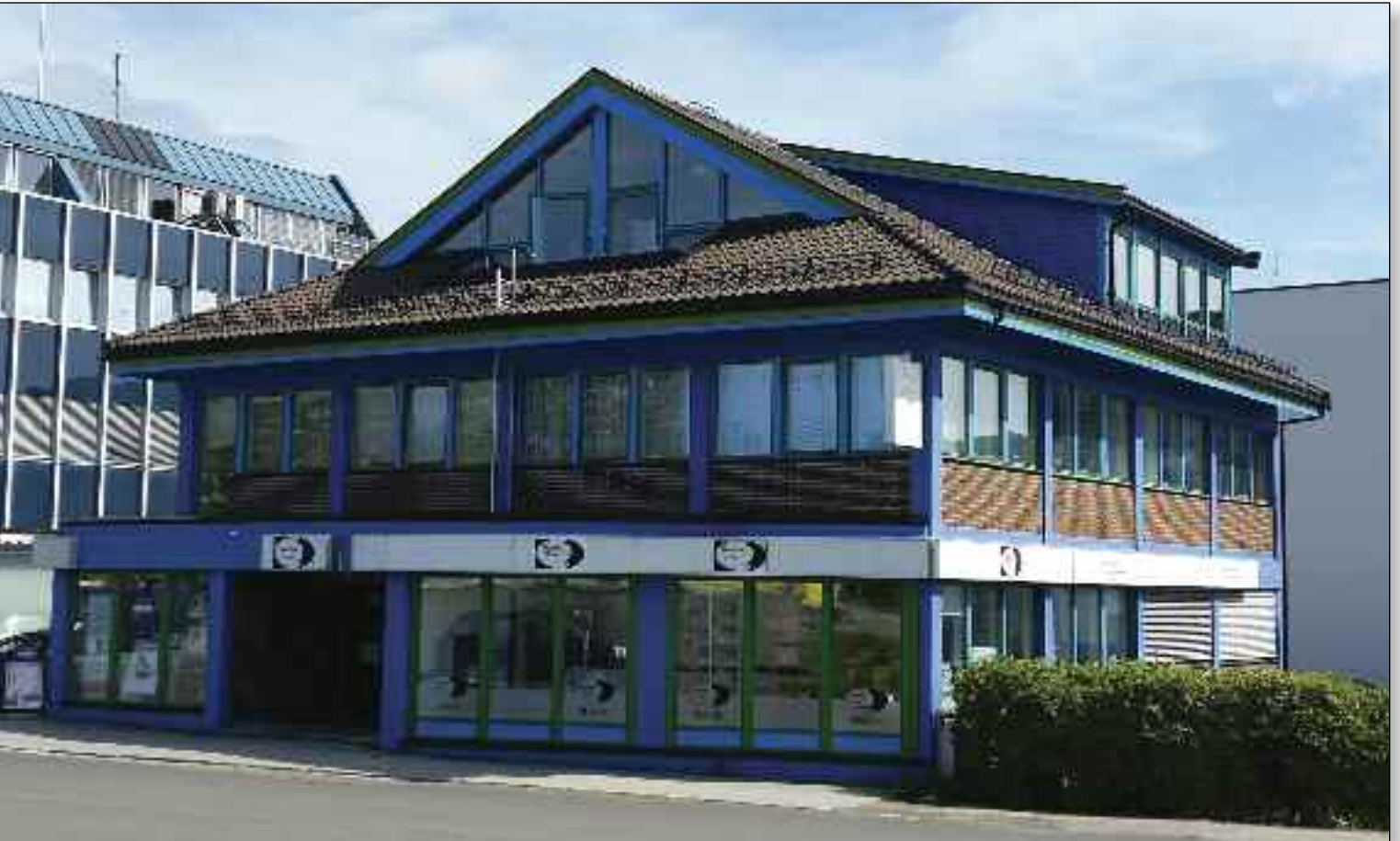
Baptistkirken på Sortland er etter hvert blitt for liten for virksomheten på stedet. Menigheten er på jakt etter større lokaler.