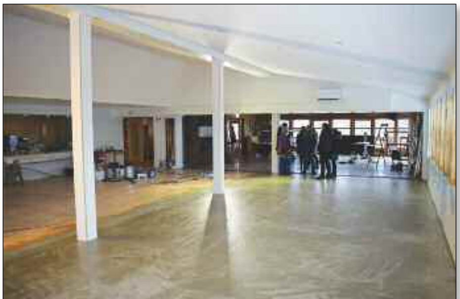
Den nye “storsalen” sett fra sørsiden.