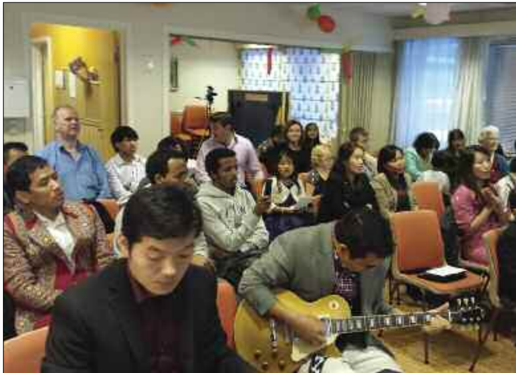
Sortland baptistmenighet et fargerikt fellesskap.

Jesus har bedt oss om å ta godt i mot innvandrerne, og spesielt huske at det å elske våre søsken i Herren ble til et nytt bud.