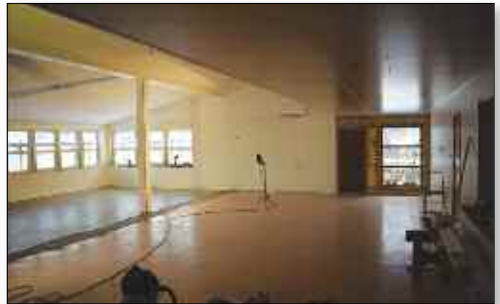
“Storsalen sett fra motsatt side av bildet nedenfor.