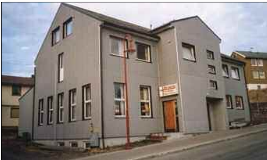
Baptistkirken i Honningsvåg vil være base for konferansens medarbeidere.

Baptist Nord melder at de siste årene har det vært kollisjoner med andre arrangement, blant annet landsmøtet. Det var først tenkt å arrangere distriktsstevne i juli, og så i august.