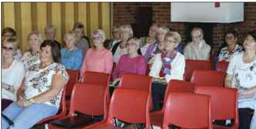
Nordnorske baptistkvinner vil ved kommende årsmøte få forsla om vedtaksendring. ILLUSTRASJONSFOTO FRA ET TIDLIGERE KVINNESTEVNE.

“Valgkomiteen velges hvert år” endres til “Valgkomiteen velges for to år om gangen”. ■