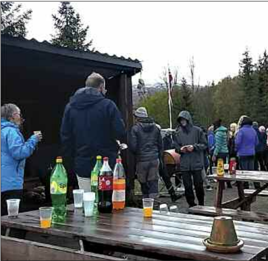
Selv om det var dårlig vær ble det en fin tur til Juksevatnet.