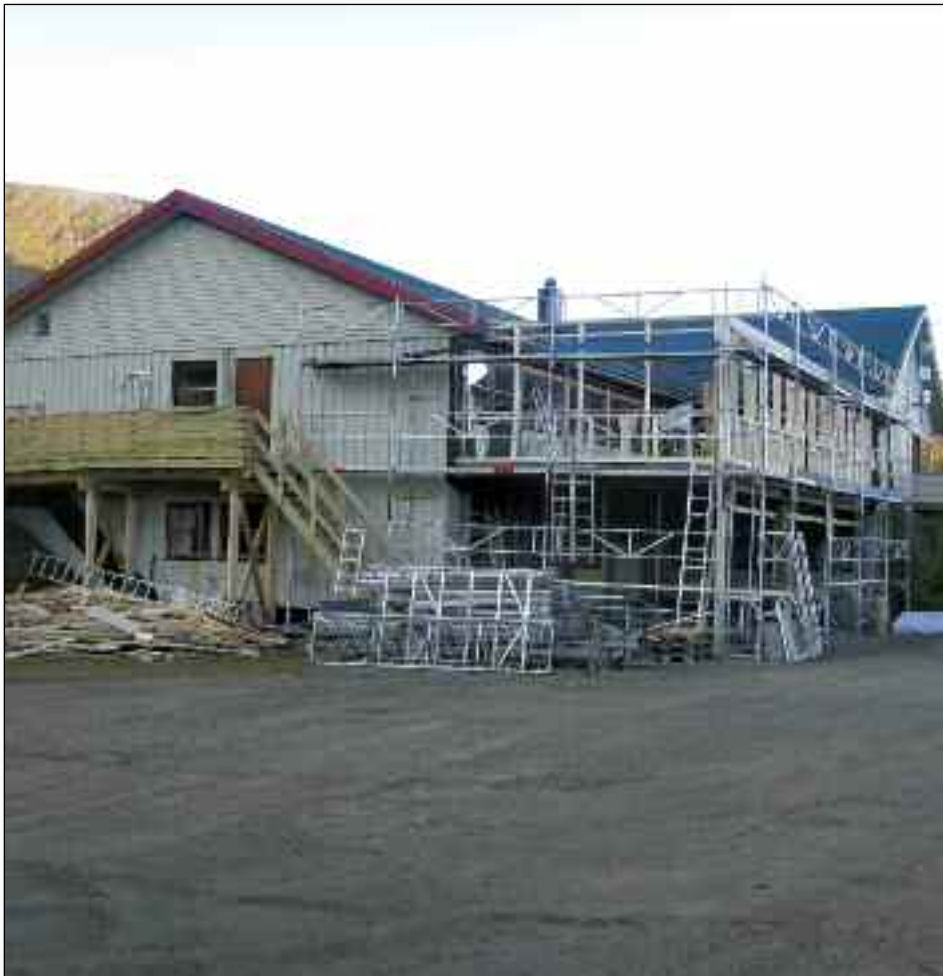
Det "nye Rivermont" er i ferd med å finne sin form