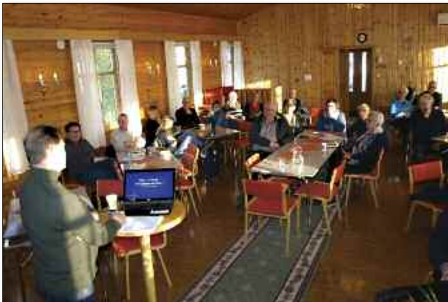
En del av Kontaktmøtets deltagere.