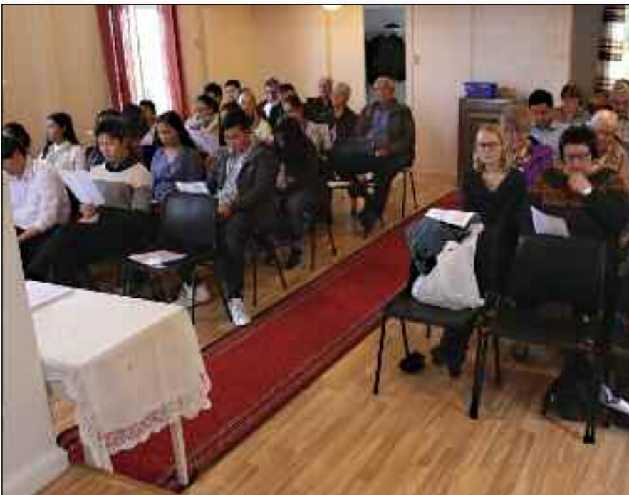
Gudstjeneste i Bjarkøy baptistkirke.

For noen år siden ble Bjarkøy Baptistmenighet lagt ned og medlemmene og alle eiendeler overført til Harstad Baptistmenighet. Etter at det i høst ble åpnet tunell mellom Grytøy og Bjarkøy ble det enklere å ta en tur til Bjarkøya.