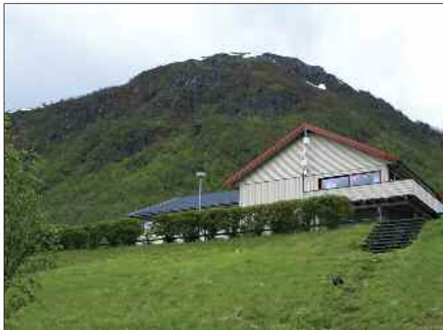
Nåværende Rivermont, som vil bli utvidet i løpet av 2019.

Er du usikker på hvor du skal sende din gave så er kontonummeret 4760 05 4560.