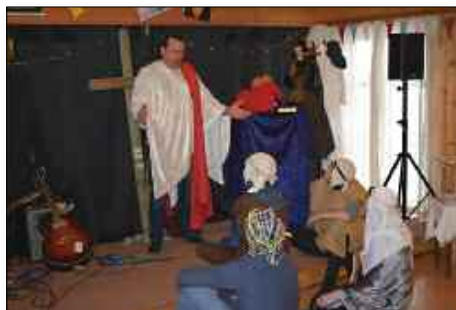
Påskens budskap ble presentert på forskjellige måter.

Det blir programtilbud for alle aldersgrupper, med finale på paldesøndag. ■