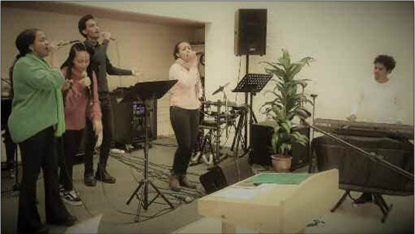
Unge og dyktige lovsangere i Rehobot Baptistmenighet leder an i lovprisningen.