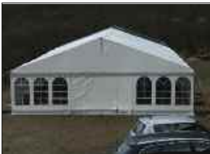
Med utbyggingen kan vi si farvel til fremtidig bruk av telt ved større arrangement.

Bruken av stedet fortalte over tid at både spisesal og peisestue burde bli større. Planer ble presentert. Planer ble forkastet. Nå foreligger det planer for utbygging. En periode fremover vil Rivermont hovedsaklig være en byggeplass. Men; om noen få måneder er utbyggingen ferdig, og vi