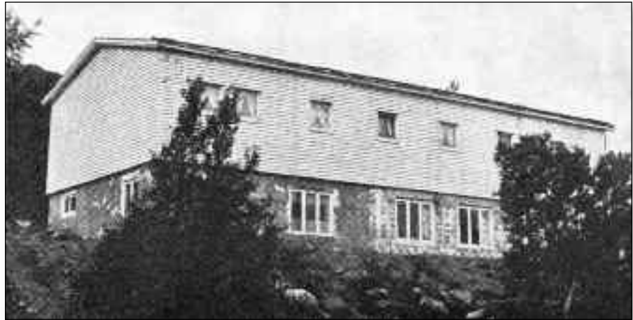
Det første Rivermont. Det har vært en utvikling.

kan igjen glede oss over et oppgradert Rivermont. Nå kan alle de nordnorske baptistmenighetene og alle øvrige venner i hele landet, vise at vi har et kjærlighetsforhold til Rivermont.