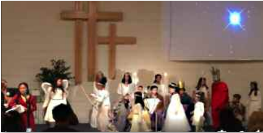
Barn og ungdommer i menigheten hadde en fin fremføring av julespillet Jesu fødsel.

3. søndag i advent har Harstad baptistmenighet markert med "Vi synger julen inn". Også i år deltok en gruppe i