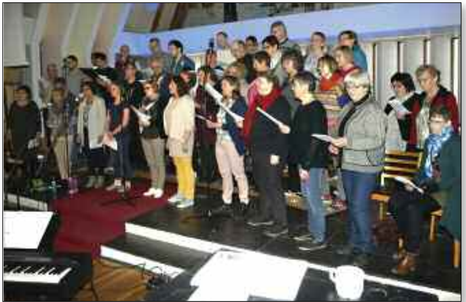
Minns Du Sången koret skal ha en øvelse og to opptredener i forbindelse med landsmøtet. Bildet er fra en øvingshelg i Harstad kirke for et par år siden.