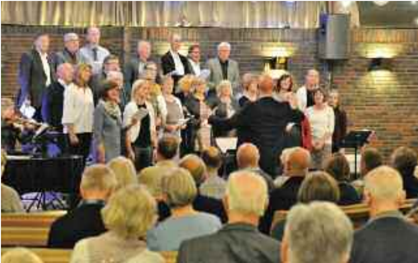
MDS-koret øvde nesten sammenhengende fra kl 0900-1730, avbrutt av lunch og kaffe-pause, for å levere best mulig til konserten. Bildet er fra konserten i Halden.