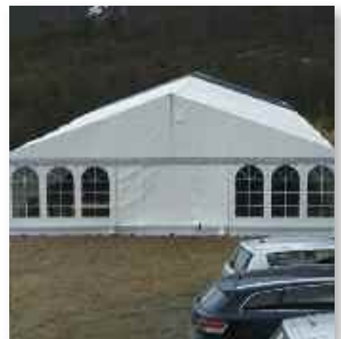
Inntil søknaden om aktivitetshall er godkjent må stevnene på Rivermont basere seg på teltleie.

Ung Baptist i Nord (tidligere NNBU) gjorde en henstilling til byggekomiteen om å utrede alternativ for plassering av hallen, for eksempel i nærheten av soveflyøyen- ■