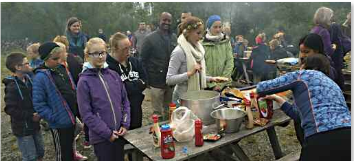
Pølsefest. Grillkveld med pølser og karbonader med salat smakte herlig