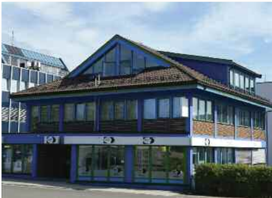
Baptistkirken på Sortland holder til i andre etasje i dette bygget. Behovet for større lokaler er nå til stede.