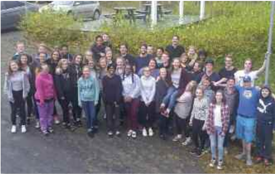
Det var et gjeng med trivelige ungdommer som utgjorde årets Høsttreff på Rivermont