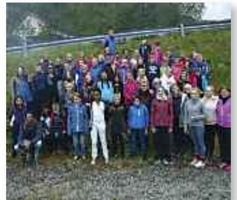
Leir. Juniorene hadde flotte dager på Rivermont. Selv om sommerværet periodevis var fraværende var stemningen på topp.