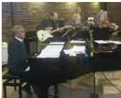
Musikerne gjorde en fremragende jobb.

Mange har stilt spørsmålet om MDS-koret vil fortsette sine konserter. Ut fra det Distriktsnytt har grunn til å tro er det allerede i gang arbeid for konserter i 2017. ■