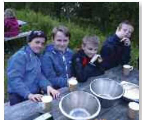
Vennskap. Det knyttes alltid nye vennskapsbånd på juniorleiren.