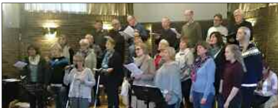
Minns du sången –koret ser frem til konsertene på Myre og Andenes

Etter en vellykket konserttur til Halden og Oslo sist høst, var det klart uttrykt fra kormedlemmene at det ikke måtte bli så lenge til neste turne.