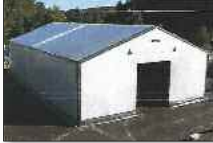
Det ventes tålmodig på en avgjørelse i byggesaken

– Søknad om dispensasjon fra byggeforskriftene ble sendt til kommunen 14. september i fjor, men pr i dag har vi ikke mottatt noen tilbakemelding om vedtak.