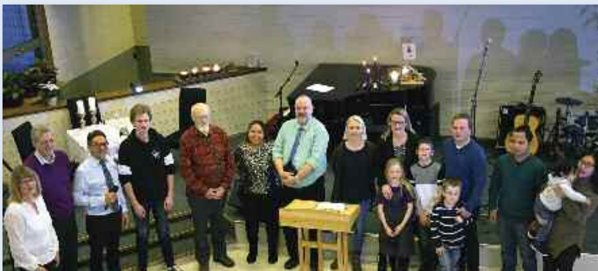
De nye medlemmene sammen med menighetens ledelse under forbønnstunden gudstjenesten.