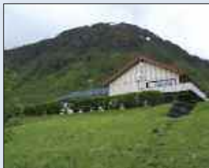
Rivermont Ungdomssenter er et unikt samlingspunkt for nordnorske baptisters fellesarbeid.

Lokalitetene på Rivermont gjør at leirar-