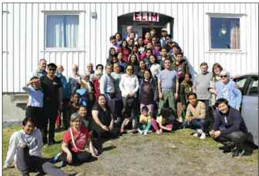
Det ble en trivelig tur til Bø. Her samlet foran baptistkirken.