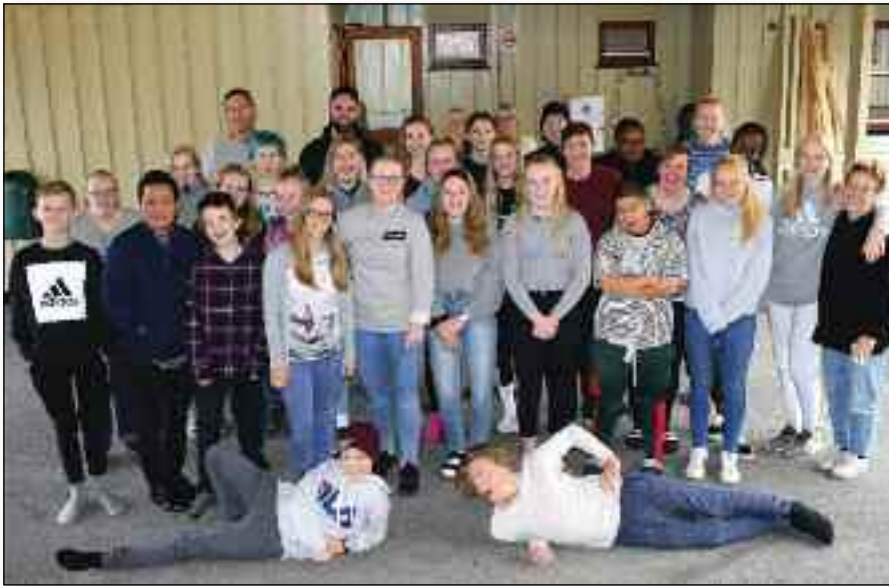
En fantastisk flott ungdomsgjeng satte hverandre i feststemning under årets Høsttreff på Rivermont