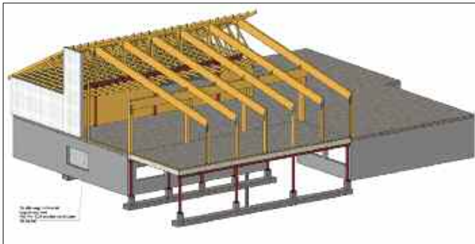
Skissen viser utvidelse av spisesalen

Går alt etter planen blir det byggestart på Rivermont etter påske. Fa Rognerud har levert laveste anbud, og før oppstart skal byggekomiteen og firmaet kontrollregne, for å unngå overskridelser.