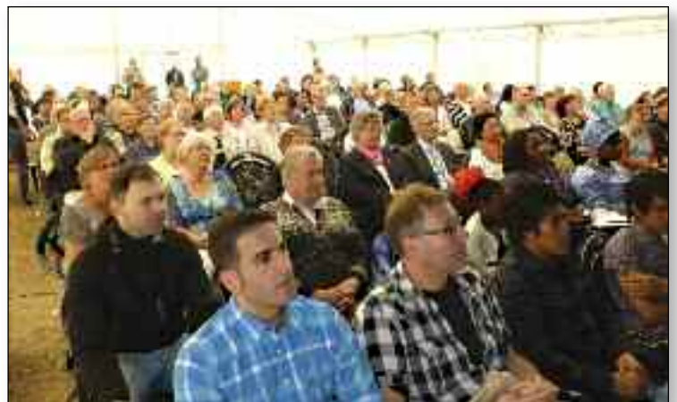
Utbyggingen gir rom for fravær av møtetelt på Rivermont.

Dette greier vi i fellesskap! Både som “enkeltbaptister” og menigheter kan vi her bidra med både kortvarig og langvarig økonomisk støtte til Rivermont, og samtidig nedbe Guds rike velsignelse over det arbeidet som gjøres på stedet, både av evangelisk og praktisk art. ■